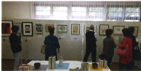
東播磨会場(兵庫県いなみ野学園)