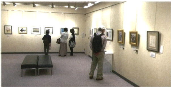
神戸会場(兵庫県民アートギャラリー)